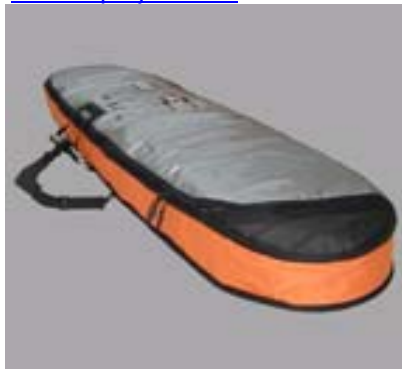
BUGZ Double Travel Boardbag

245 / 8'0'' for Flight transport #11781 99,90 €