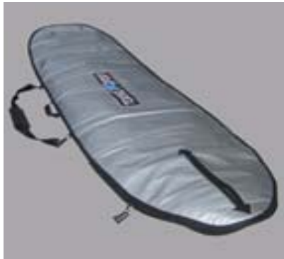
BUGZ Surfboard Bag for Longboards

185 / 6'2'' for Flight transport #11788 99,90 €