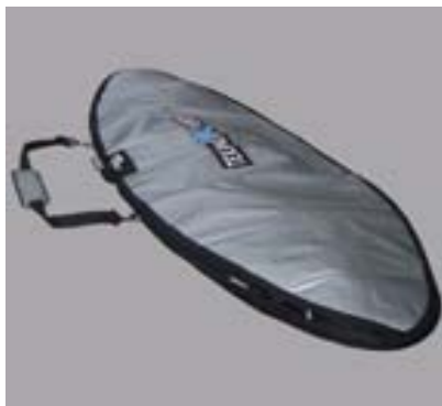
BUGZ Surfboard Bag for Shortboards