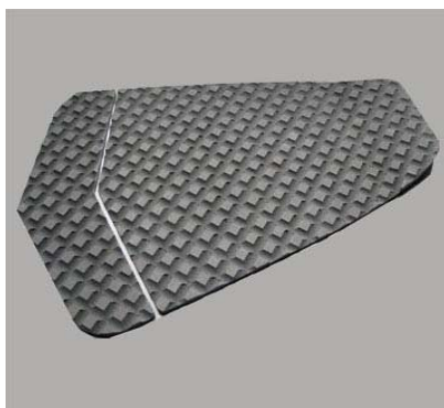
Surfboard Tailpad KALAMA #11046

Surfboard tailpad with kick tail, self adhesive. Color: White / Blue 19,90 €