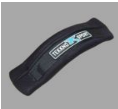
Footstrap "Mega" #13106

Unisize with Neoprene cap inside 39,90 €