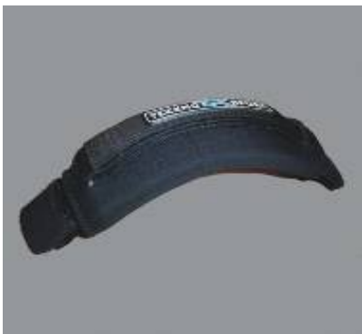
Footstrap "Mega Ergo Barefoot" #13105

a Mega footstrap with tight fit velcro Neoprene 9,90 €