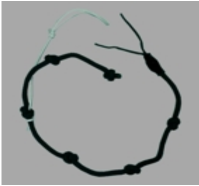
Startshot / Uphaul CLASSIC #13557

Classic Uphaul for beginners with a thick, fix rope and knots. 9,90 €