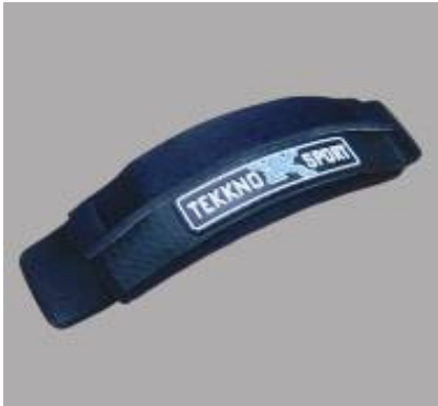
Footstrap "Standard" #13112

vario velcro on the outside for easy adjustment 12,90 €