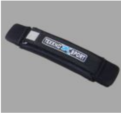
Footstrap "Buckle Vario" #10883

vario velcro on the outside for easy adjustment 12,90 €