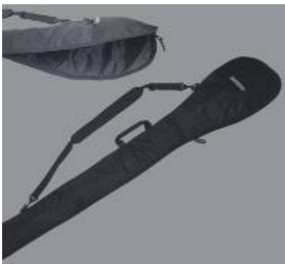
Paddle Bag Single #12894