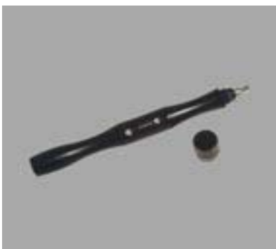
Trimm Tool #13553 Philips Kreuz Kopf