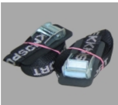
Spanngurt 4m x 25mm #13559