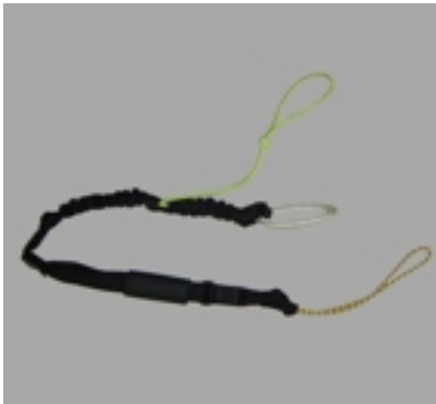
Startshot / Uphaul EASY UPHAUL www.easy-uphaul.com #13556

Classic Uphaul for beginners with a thick, fix rope and knots. 9,90 €