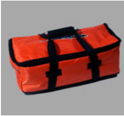
Finbag Pro #12499 8 Fins