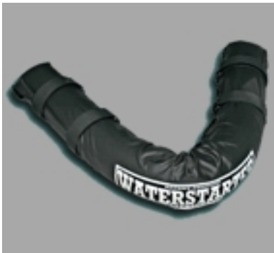
Waterstarter www.waterstarter.com #13551

Flexible uphaul with vario length and loop to uphaul the rigg by hooking into the Harness hook. 29,90 €