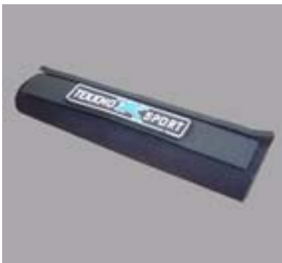
Footstrap cover #13111

standard Footstrap, half Neoprene cover 12,90 €