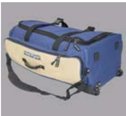
Traveller Pro #11646 Grosse Reisetasche mit Rollen