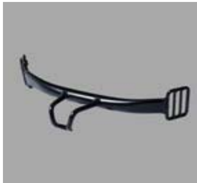
Trapezhaken Schnellabwurf / Quick Release #12964