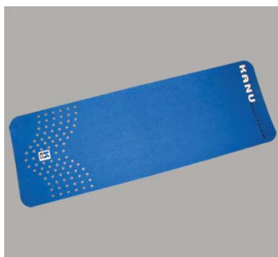
Deck Pad Kanu Blue #16520