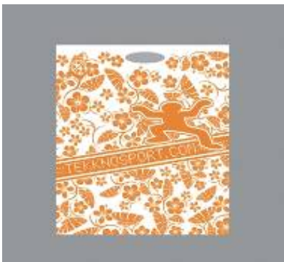
Tekknosport PE Tragetasche

Small, 38x44x5 cm keine Angabe VPE/Cartron = 500 pcs