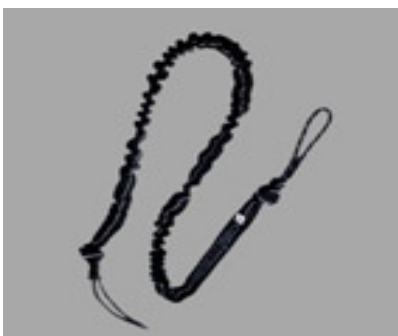
Startshot / Uphaul PRO #13555

Leight weight elastic uphaul for Advanced Windsurfers 9,90 €