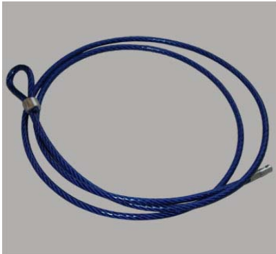
Diebstahlsicherung, steel cable