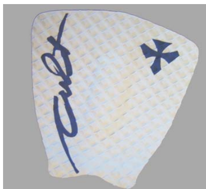
Surfboard Tailpad CULT mit Kicktail #13349