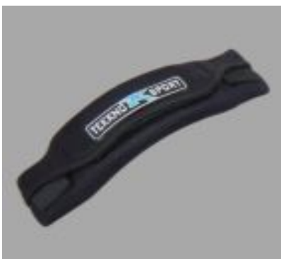
Footstrap "Strong X" #13101

Ergonomic Mega Strap, vario velcro on the outside for easy adjustment 15,90 €