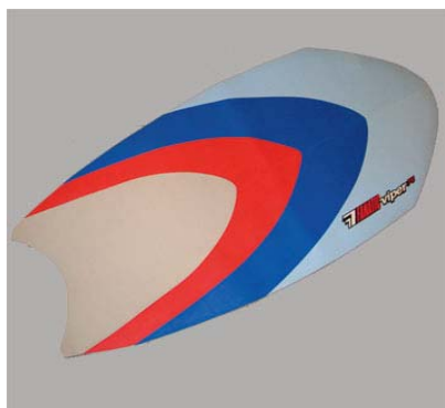
Deck Pad Complete #16397

Fanatic Viper 2004, ca 175x80x0,3cm, nicht selbstklebend