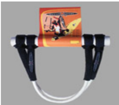
Harness Line 20" #12945 22" #12944 24" #12943 26" #12942

50cm / 20" 19,90 € 55cm / 22" 60cm / 24" 65cm / 26"