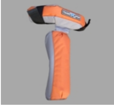
Boom Nose Protector #12293

Nose Protector for boom, Mast, boards nose in one piece 19,90 €