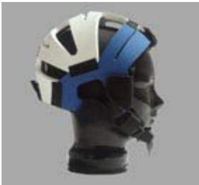
Surfhelm E.V.A. #12290

Nose Protector for boom, Mast, boards nose in one piece 19,90 €