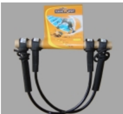
Harness Line vario "rope" #12941

50cm / 20" 19,90 € 55cm / 22" 60cm / 24" 65cm / 26"