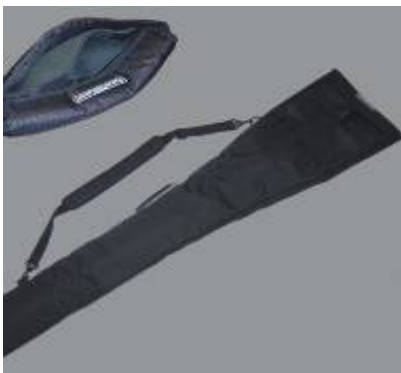
Paddle Bag DeLuxe #12895

160x27x6cm For 1-2 Paddles or long 2-ciece Paddle