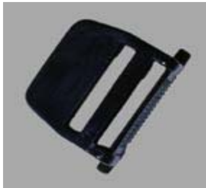
Schnellabwurf Schnalle #12962