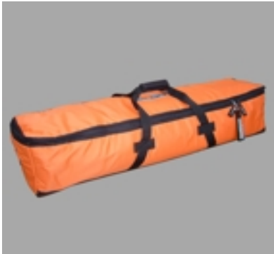
Finbag Formula #12500 8 Formula Fins